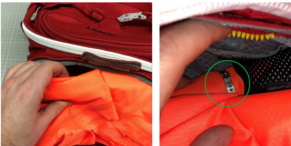
Illustration : Mammut Protection Airbag System (PAS)

3. Soulève l'airbag plié avec précaution, de manière à ce que la bague de serrage (entourée en vert sur la photo) entre l'airbag et l'Inflation System soit bien visible.