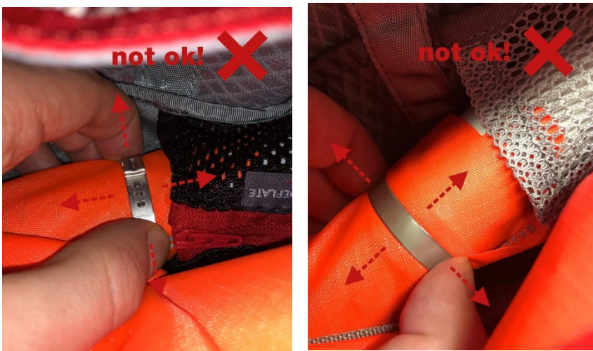
Illustration : Mammut Protection Airbag System (PAS) et Mammut Removable Airbag System (RAS)