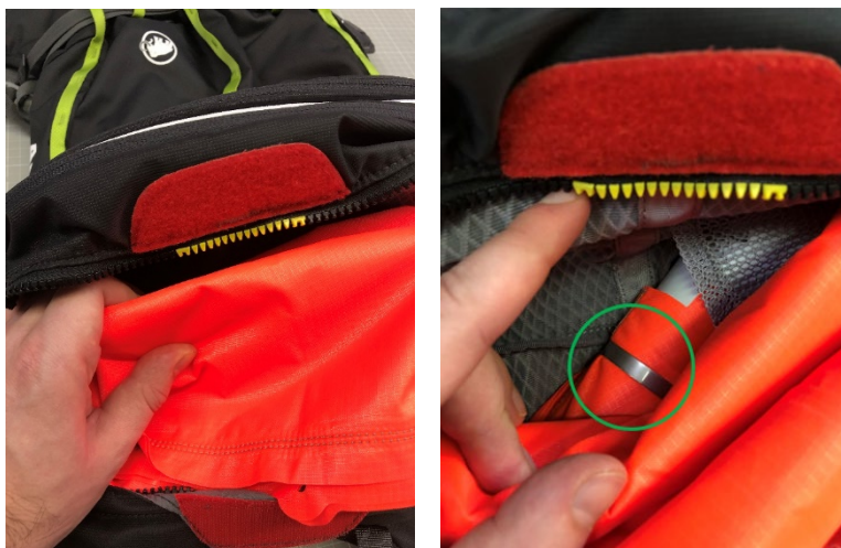
Illustration : Mammut Removable Airbag System (RAS)