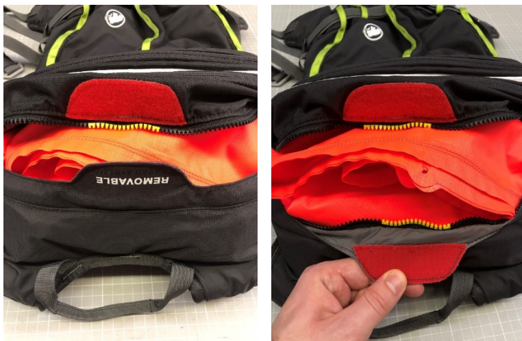
Illustration : Mammut Removable Airbag System (RAS)

3. Soulève l'airbag plié avec précaution, de manière à ce que la bague de serrage (entourée en vert sur la photo) entre l'airbag et l'Inflation System soit bien visible.