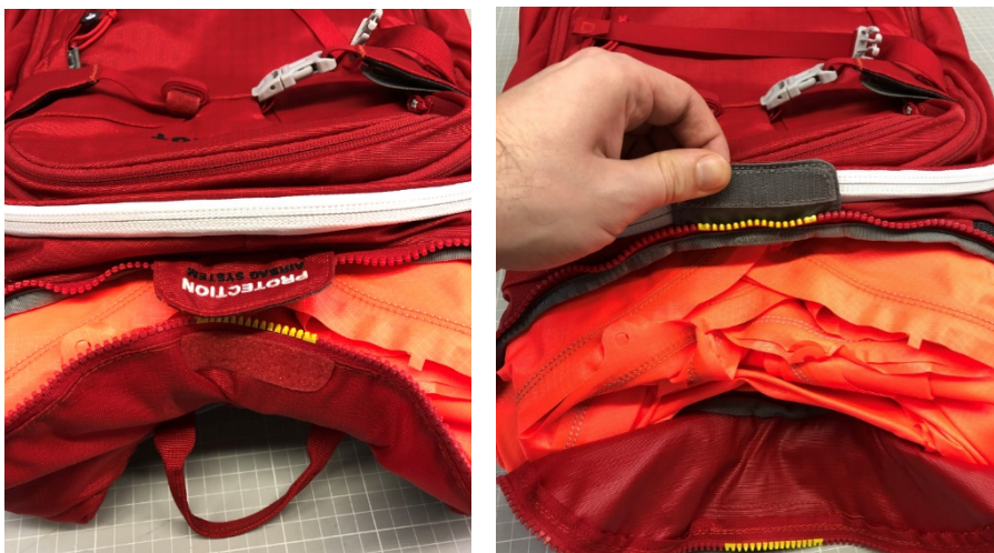
Illustration : Mammut Protection Airbag System (PAS)

Remarque : si l'airbag se déplie à l'ouverture du compartiment, il convient, pour le bon déroulement de ce contrôle de sécurité, de le replier selon les instructions figurant dans le manuel d'utilisation : https://eu.mammut.com/service/avalanche-airbags/user-manuals/